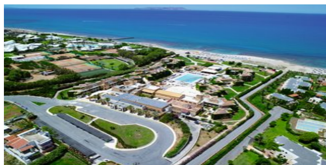
Blick auf die Anlage