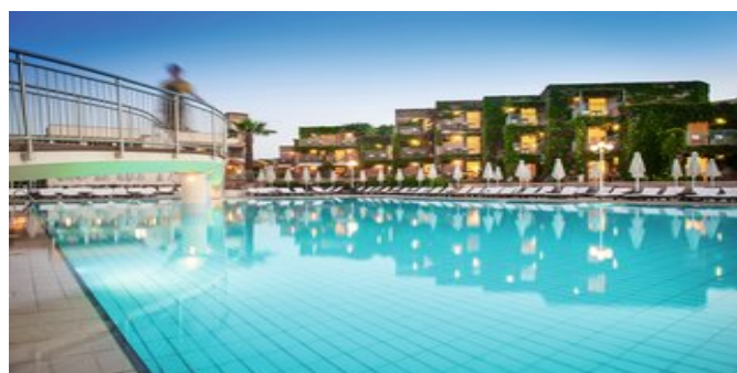
An einem der Pools