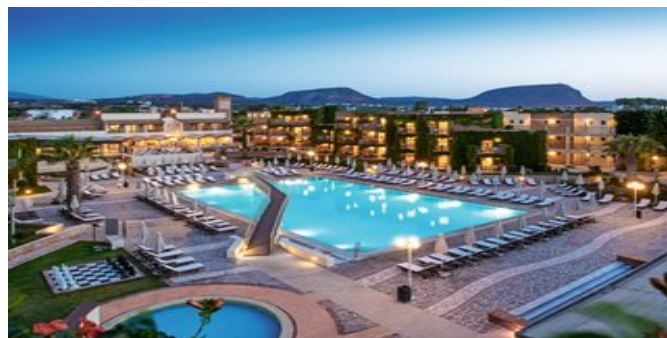
Das Bella Beach Hotel

POOLBEREICH Im schönen Garten verteilen sich 2 Süßwasserpools und 1 Kinderpool, jeweils mit Sonnenterrasse, Liegen, Sonnenschirmen und Pooltüchern. Pool-/Snackbar "Rotonda".