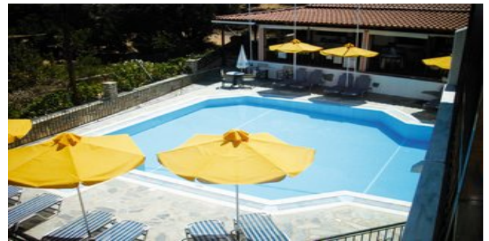
Blick auf den Pool