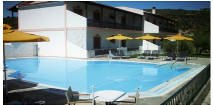
Die Appartements Sun Waves mit Pool

Website: www.attika.de E-Mail: verkauf@attika.de