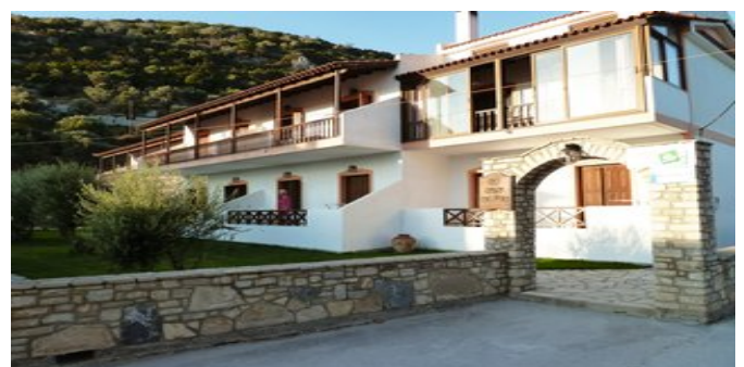
Die Anlage Sun Waves