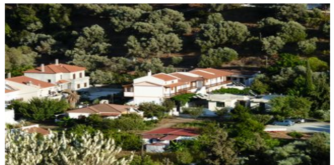
Blick auf die Anlage