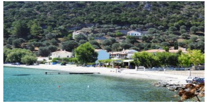
Blick auf die Bucht und die Anlage

SPARTIPP Bei Buchung eines Attika Mietwagens ab/bis Flughafen Transfergutschrift EUR 68 pro Person. Einen Mietwagen der Kat. A1 erhalten Sie schon ab EUR 140 pro Woche.