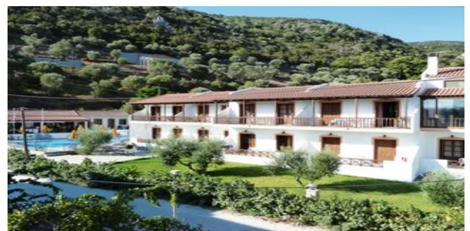
Die Anlage Sun Waves