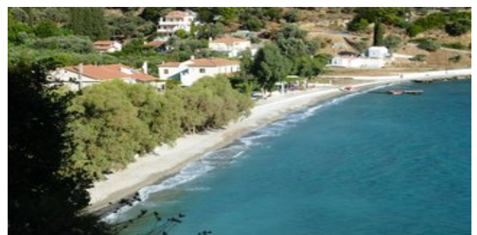
Die Bucht bei der Anlage