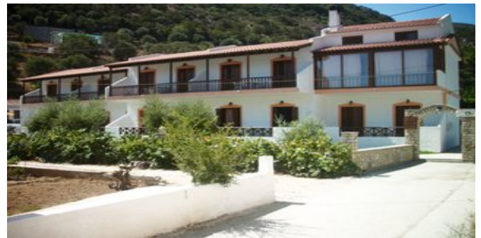
Die Appartements Sun Waves