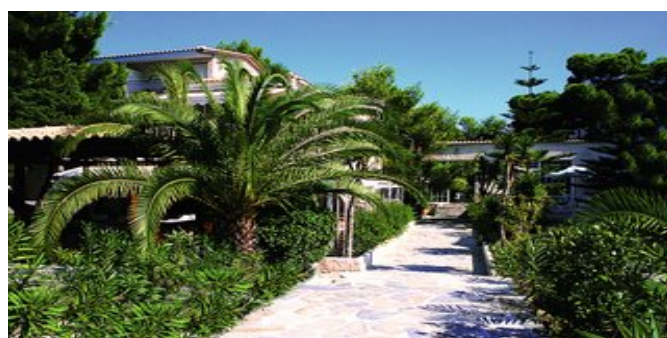
Das Hotel Aquarius