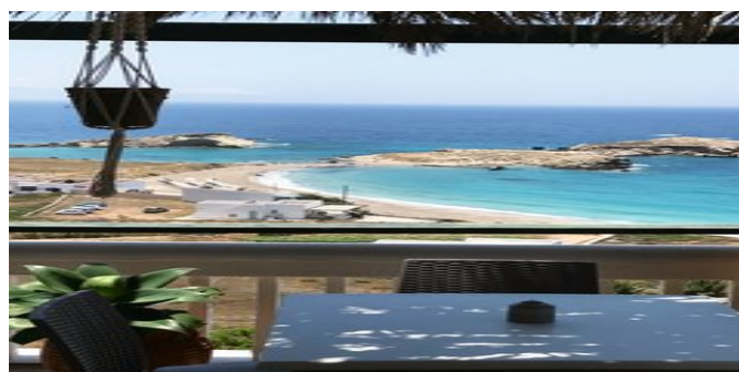
Blick von der Anlage