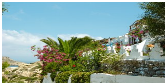
Die Studios Sunset

HAUSCHARAKTER Das freundliche Besitzerpaar führt am Ortseingang die urgemütliche Taverne "Small Paradise" mit ausgezeichnete Küche. Die Besitzerin Irini kocht selbst und bietet ein