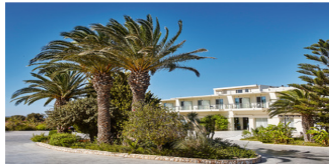
Das Ammos Resort