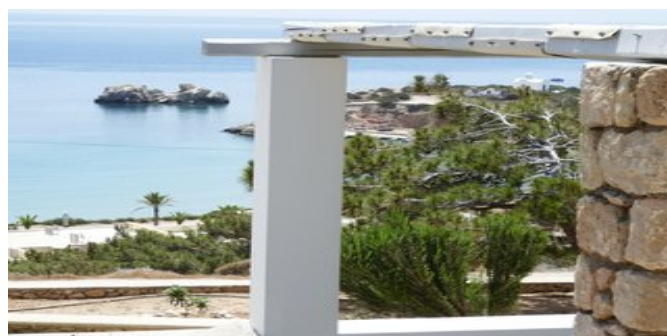
Blick von der Anlage