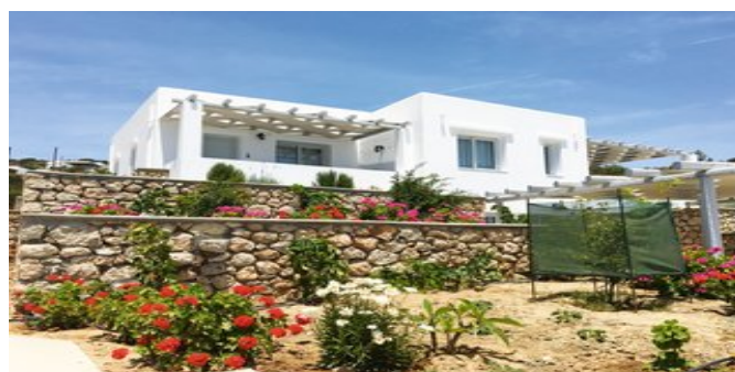
Die Anatoli Villas