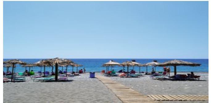
Der Strand beim Hotel