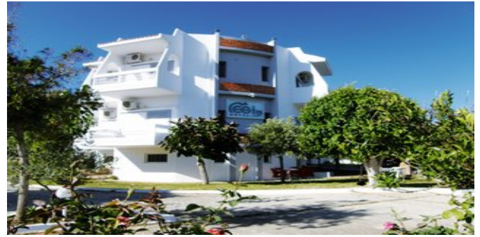
Das Hotel Megim