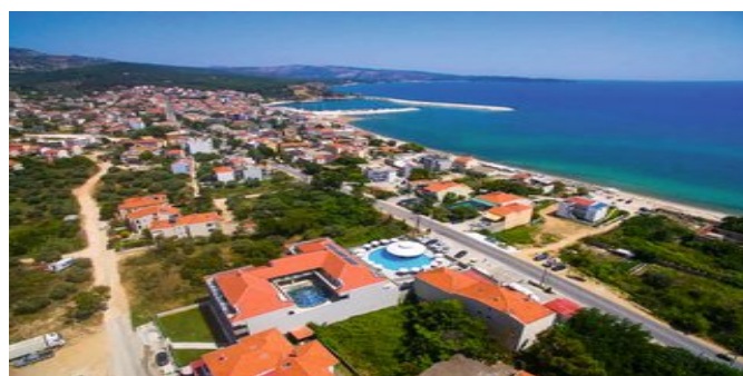
Blick auf die Anlage