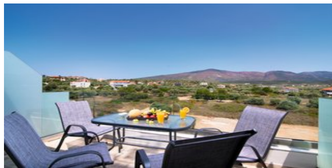
Auf dem Balkon