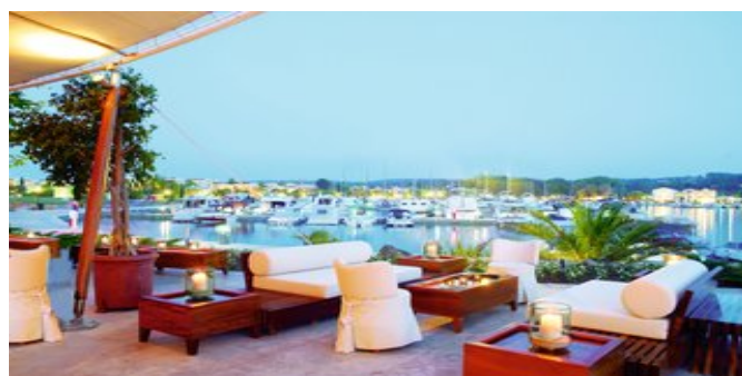
Die Water Bar