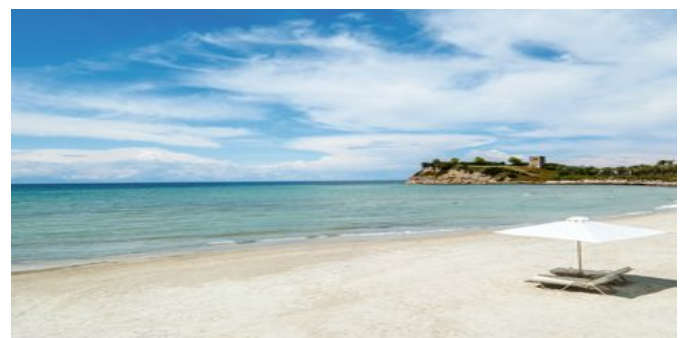
Der Strand beim Hotel