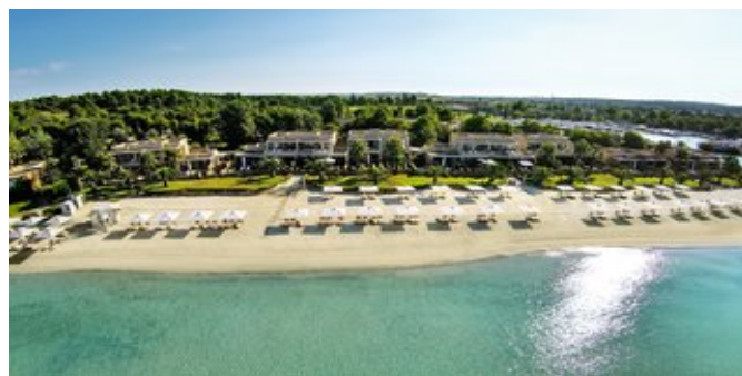
Blick auf Sani Asterias