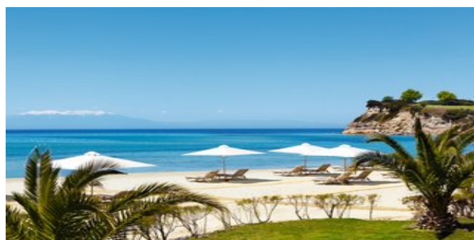
Der Strand beim Hotel