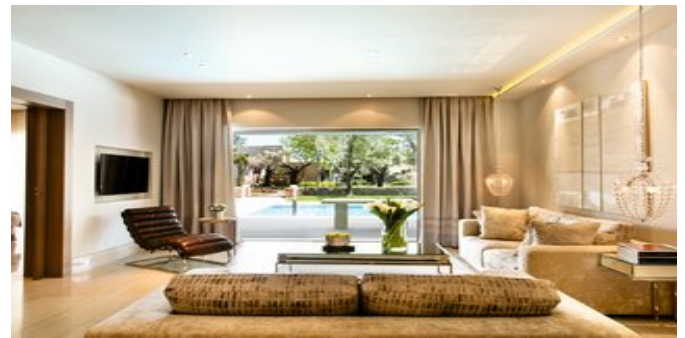
Wohnbeispiel Deluxe Suiten privater Pool