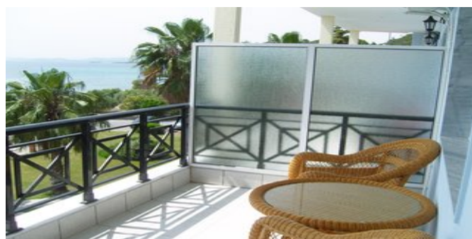
Auf dem Balkon