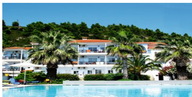
Blick auf das Lily Ann Beach