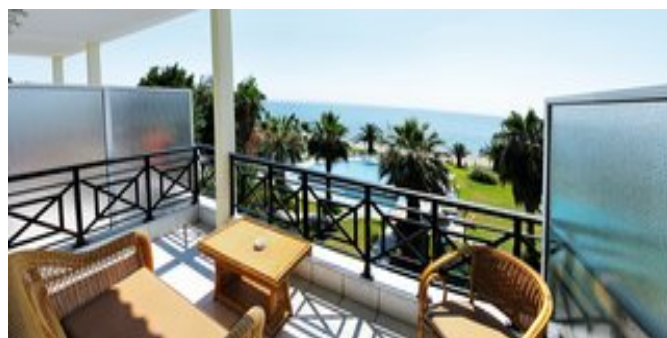
Auf dem Balkon