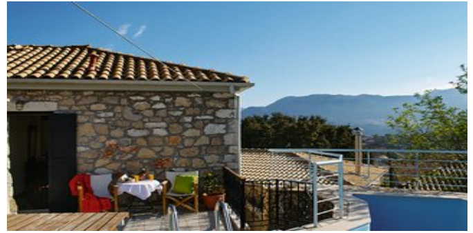
Die Villa Architect House