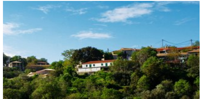
Die Villa Architect House