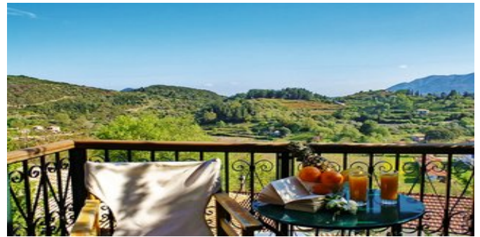
Auf dem Balkon