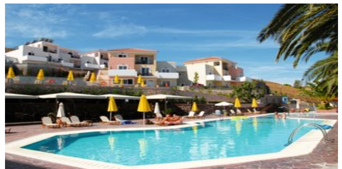
Das Sunrise Resort Hotel mit Pool