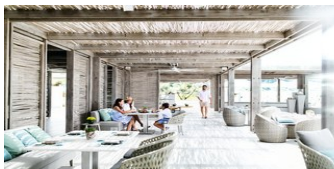
Das "Beach House" Restaurant