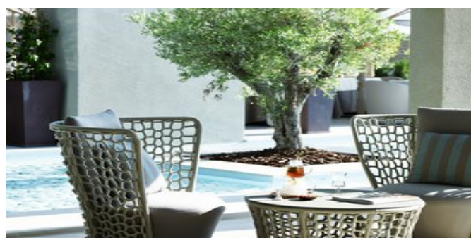
Auf der Terrasse der Lobbybar