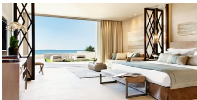
Wohnbeispiel Deluxe Juniorsuiten