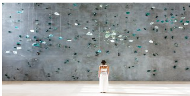
In der Lobby