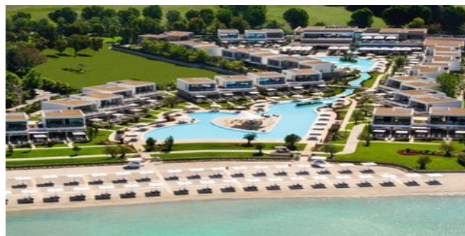
Blick auf die Anlage

AKTIVITÄTEN / SPORT Ohne Gebühr: Tischtennis, Spiele und Unterhaltung mit Volleyball, Gymnastik. Große Shows im "Garden Theater". Folklore und Live-Musik. Strandparties. Adventure-Park. Gegen Gebühr: 8 CANADA TENN Tennisplätze, davon 3 mit Flutlicht und Rafa Nadal Tennisschule und Chelsea Fußball Akademie. Mountainbike-Station mit Fahrradverleih. Am Strand umfangreiches Wassersportangebot, PADI-Tauchcenter im Sani Beach. Sani Open Air Musik & Kultur Festival (Juli-August) auf dem Sáni-Hügel.