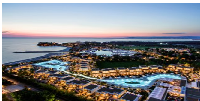
Blick auf die Anlage