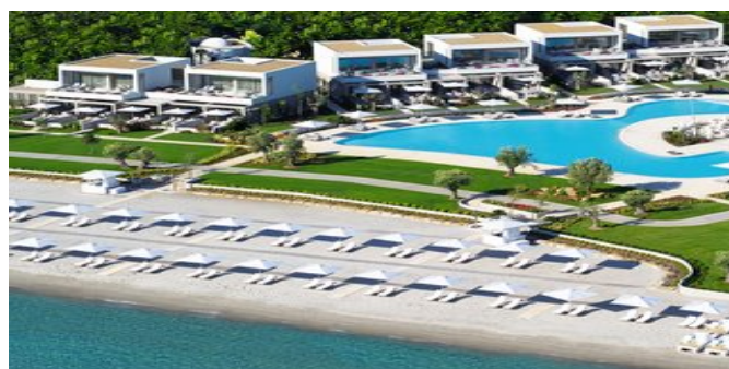
Blick auf die Anlage