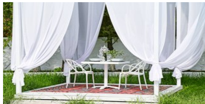
Im Garten des Hotels

HINWEIS Adults Only - das Hotel ist für Gäste ab 16 Jahren buchbar.