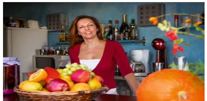
Die freundliche Besitzerin