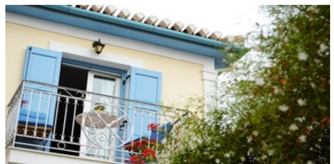
Blick auf das Hotel