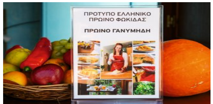
Initiative "Greek Breakfast"