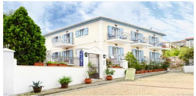
Das Hotel Miramare