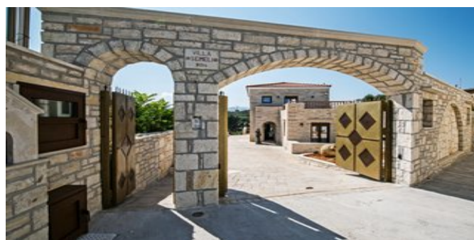
Der Eingang zur Villa