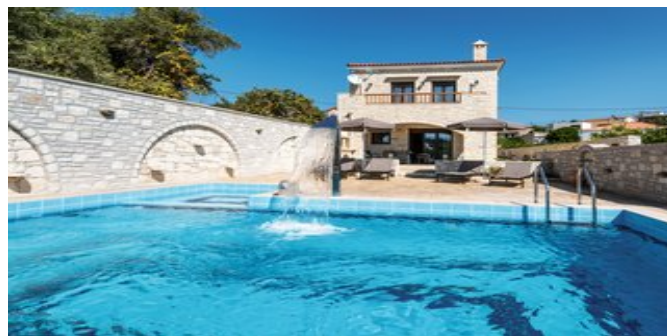
Die Semeli Villa mit Pool

SPARTIPP Bei Buchung eines Attika Mietwagens Transfergutschrift ab/bis Chaniá EUR 132, ab/bis Heráklion EUR 98 pro Person. Einen Mietwagen der Kat. A1 erhalten Sie schon ab EUR 140 pro Woche.