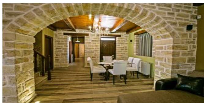
Blick auf den Essbereich