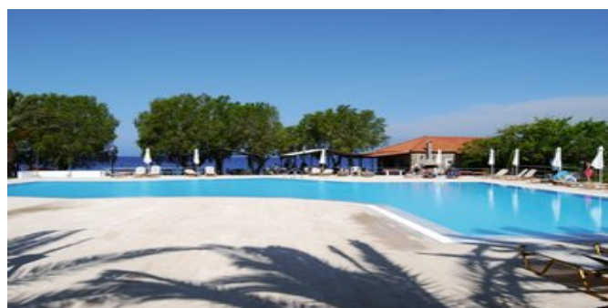
Der Poolbereich mit Taverna