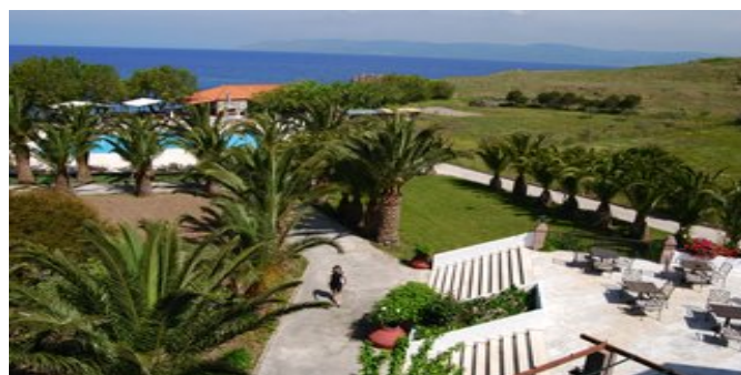
Blick über die Anlage