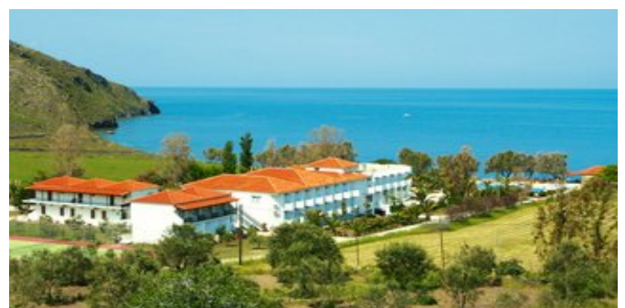
Das Hotel Aphrodite