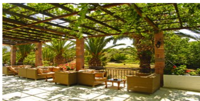
Auf der Terrasse