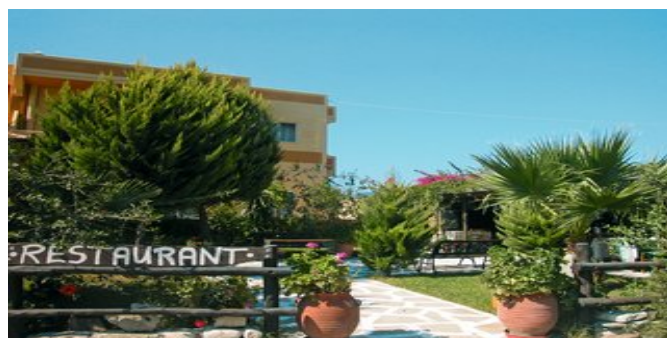
Die Pension Liros