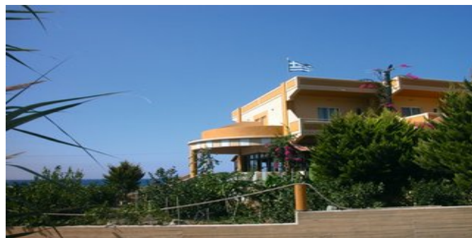
Die Anlage Liros