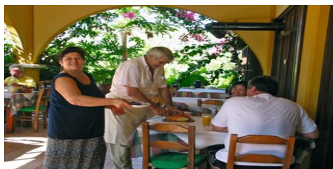
Die freundlichen Besitzer