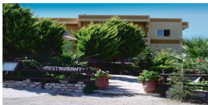
Die Pension Liros