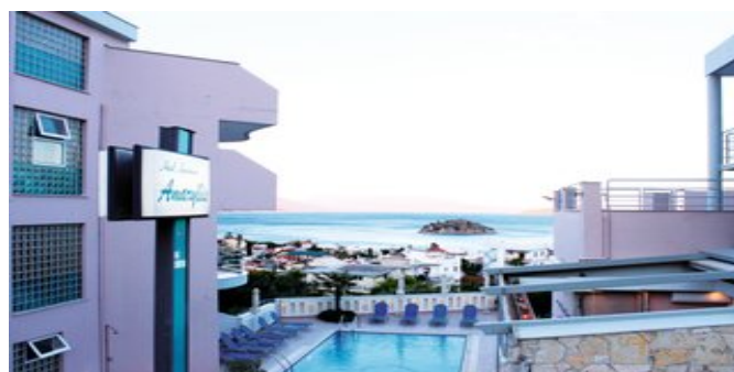
Das Amaryllis Hotel