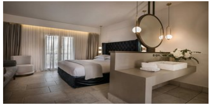
Wohnbeispiel Deluxe Zimmer

SPARTIPP Bei Buchung eines Attika Mietwagens Transfergutschrift ab/bis Flughafen EUR 46, ab/bis Hafen bis zu EUR 106 pro Person. Einen Mietwagen der Kat. A1 erhalten Sie schon ab EUR 147 pro Woche.