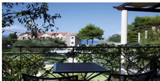
Auf dem Balkon