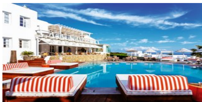
Das Hotel Archipelagos