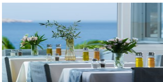
Die Terrasse des Restaurants