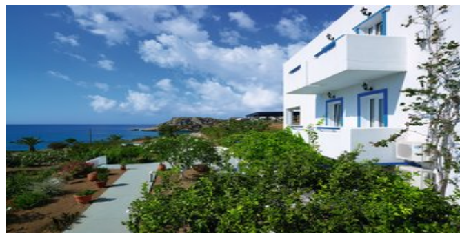
Ein Teil der Anlage

VERPFLEGUNG ÜF (umfangreiches Frühstücksbuffet).