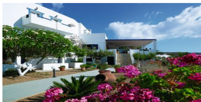
Das Hotel Argo mit schönem Garten