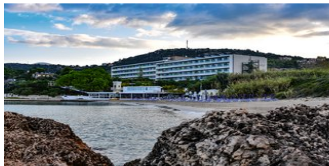
Das Hotel Mediterranee

UNTERHALTUNG Gelegentlich Unterhaltungsprogramm wie Live-Musik und