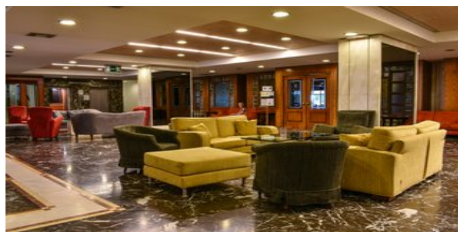
In der Lobby