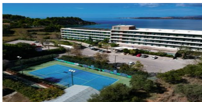
Blick auf das Hotel