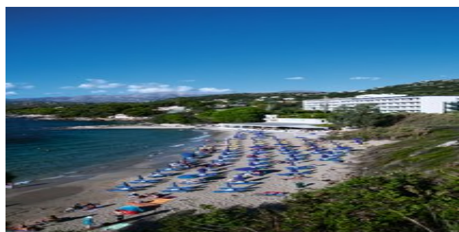
Der Strand beim Hotel