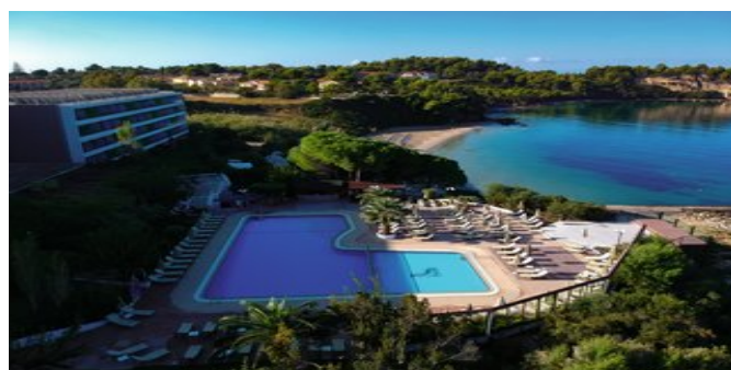
Blick auf den Pool und das Meer