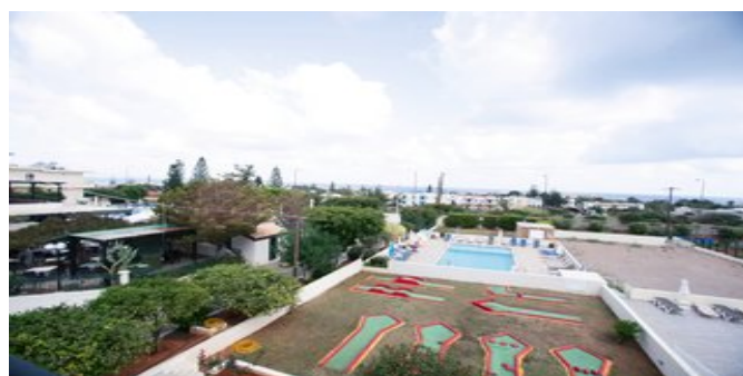
Blick über die Anlage