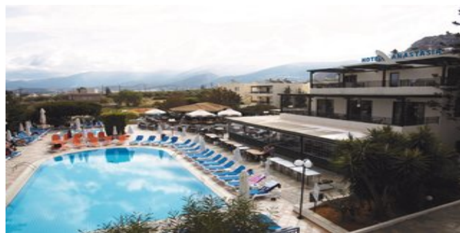
Das Hotel Anastasia

STRAND Flach abfallender Sandstrand mit Liegen und Sonnenschirmen (gegen Gebühr). Wassersportmöglichkeiten (gegen Gebühr, lokale Anbieter).