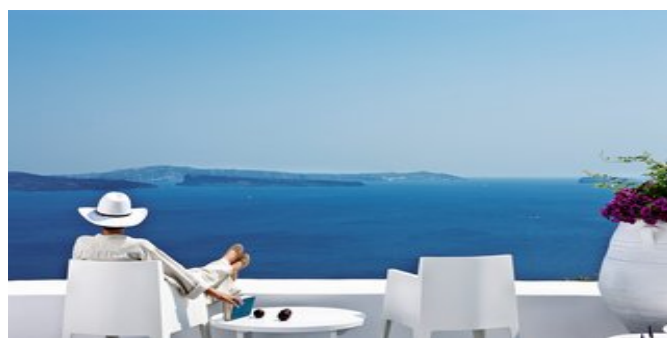
Zeit zum Genießen