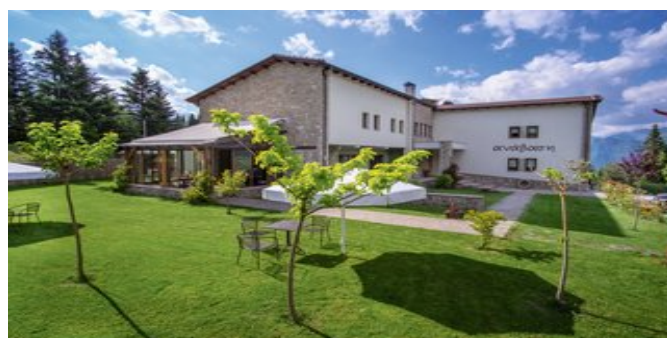
Das Anavasi Mountain Resort