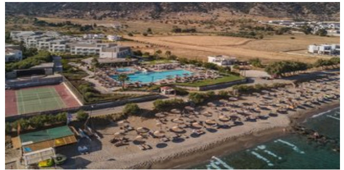
Blick auf die Anlage

POOLBEREICH Nur ca. 10 Meter vom Strand entfernt befindet sich der 800 m 2 große Süßwasserpool mit Poolrestaurant/Snackbar. Kleines separates Kinderbecken. Liegen und