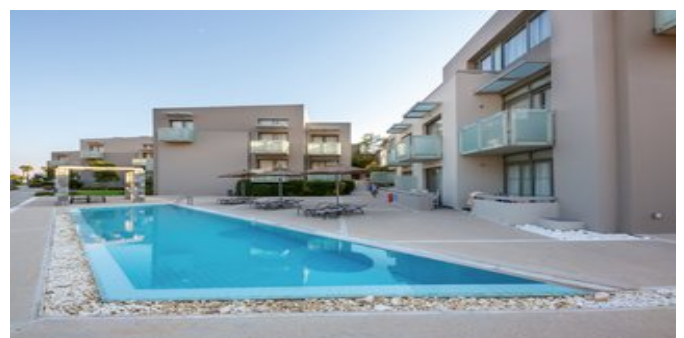
Das Hotel Akti Palace