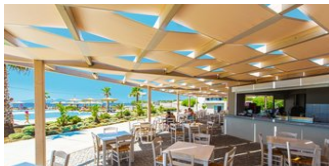
An der Pool-/Snackbar