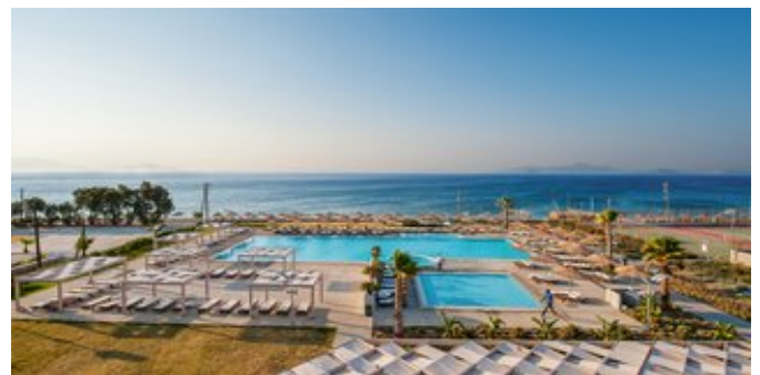
Blick über den Poolbereich