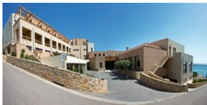
Das Hotel Kymi Palace