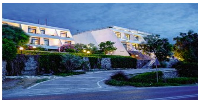
Das Hotel Hippocampus