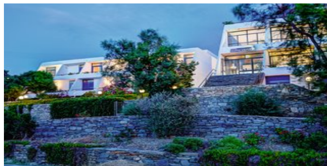
Das Hotel Hippocampus

STRAND Zum naturbelassenen Mini-Piperaki-Strand (Sand-/Felsenstrand) mit ein paar Schatten spendenden Bäumen sind es ca. 30 m. Der Piperi Strand, ein von Felsen umgebener, kleiner Sandstrand mit ein paar Liegen und Sonnenschirmen (in der Hochsaison und gegen