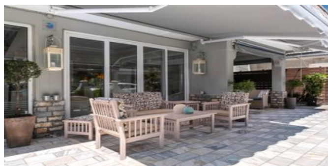
Die schöne Hotelterrasse