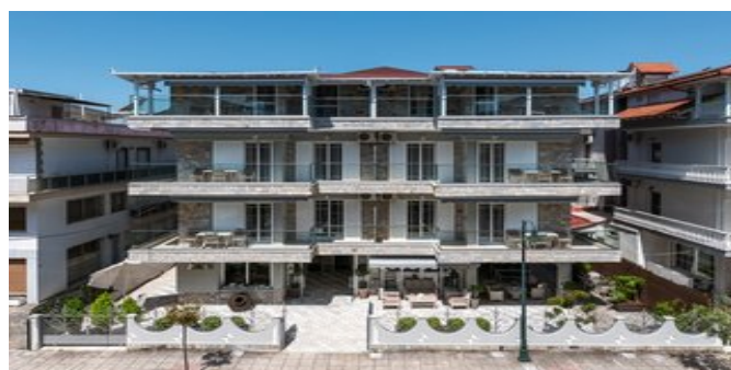
Das Ouzas Luxury Hotel