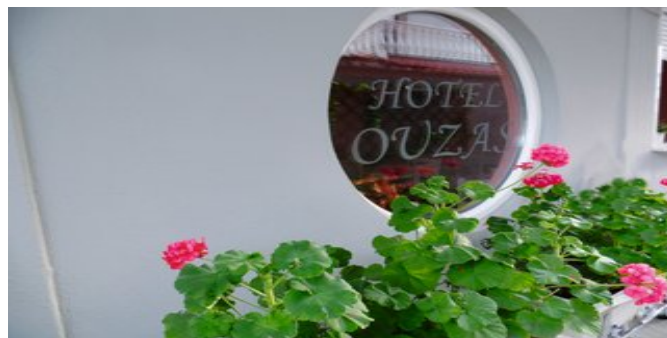
Das Ouzas Hotel

ATTIKA SERVICE Taxi-Transfer bei Pauschalreise inklusive.