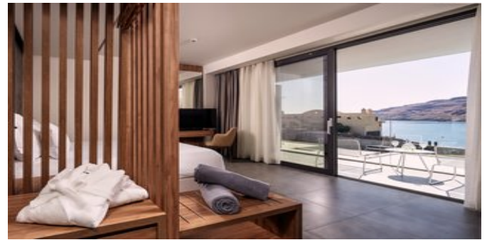
Wohnbeispiel Deluxe Zimmer