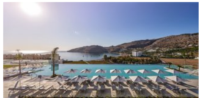
Ausblick vom Pool