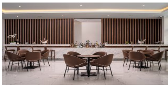
In der Lounge Bar