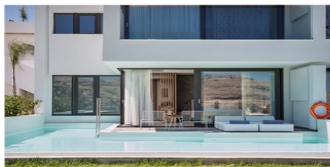
Wohnbeispiel Deluxe Juniorsuiten