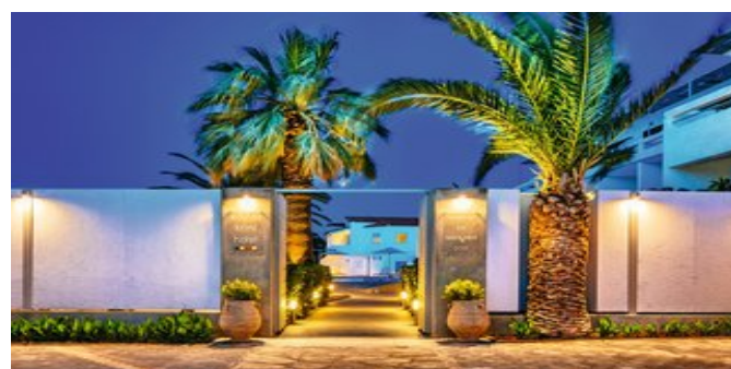
Das Elounda Krini Hotel