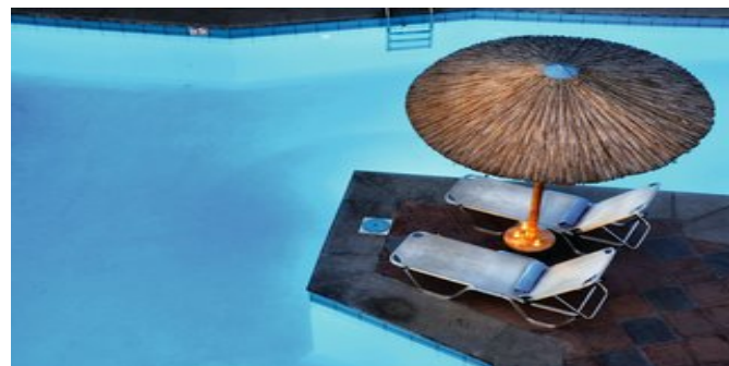
Abendstimmung am Pool