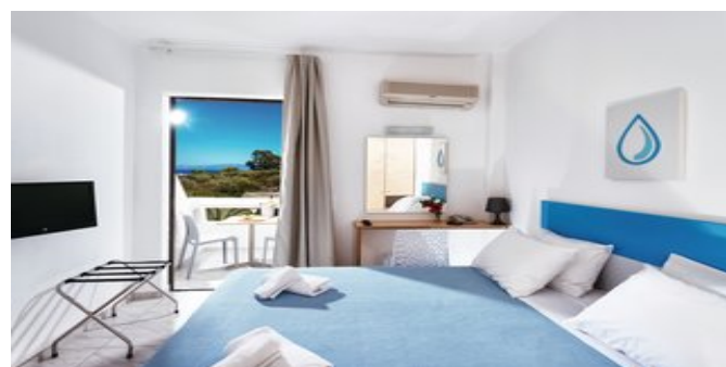
Wohnbeispiel Superior Zimmer