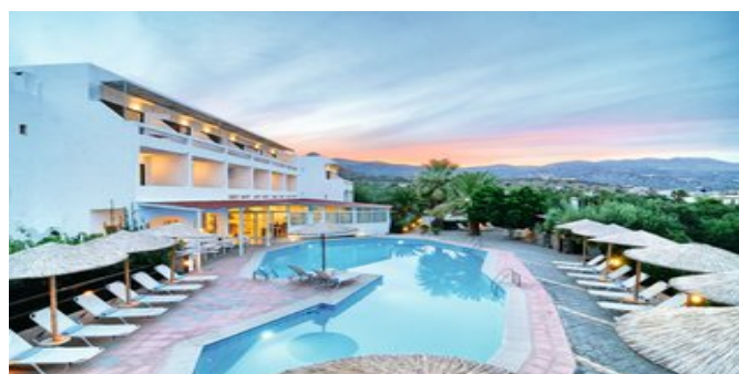
Das Elounda Krini Hotel mit Pool