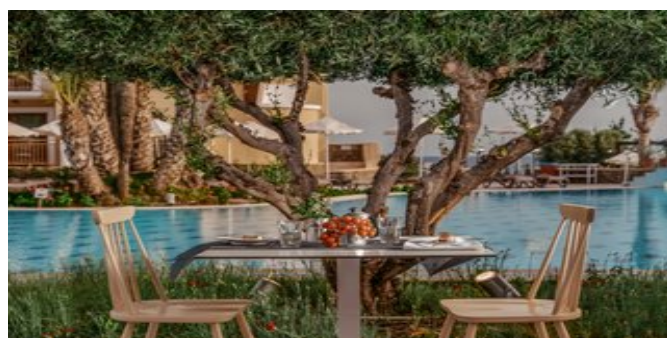
Im "Meze Meze" Restaurant