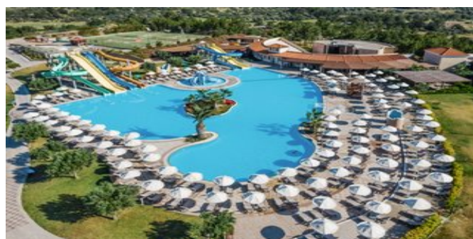
Blick auf einen der Pools