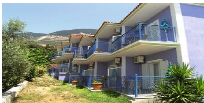
Die Milos Studios