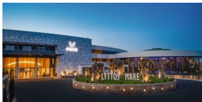
Das Lyttos Mare