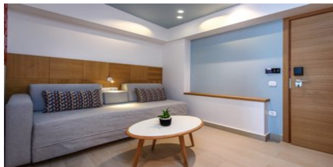
Wohnbeispiel New Club Suiten

JUNIOR SUITEN PRIVATER POOL (UA) Ca. 37 qm. Für 2-3 Personen. Grundausrüstung wie die Superior Zimmer. Wohn-/Schlafraum mit Doppelbett und Schlafsofa. Walk-In Dusche/WC, Föhn, Bademantel, Slipper, Pflegeprodukte. Terrasse mit