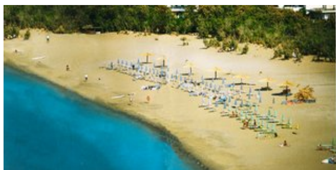
Der Strand von Paleochóra