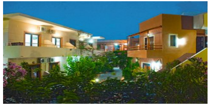
Die Appartements Lito

SPARTIPP Bei Buchung eines Attika Mietwagens ab/bis Flughafen Transfergutschrift EUR 140 pro Person. Einen Mietwagen der Kat. A1 erhalten Sie schon ab EUR 140 pro Woche.