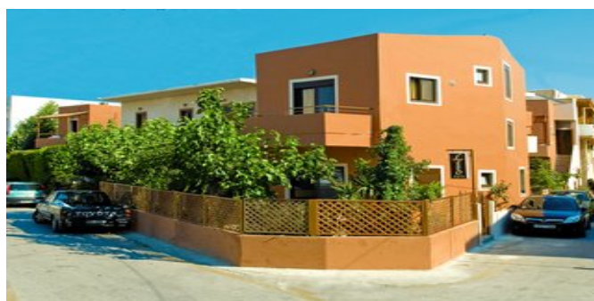
Die Appartements Lito