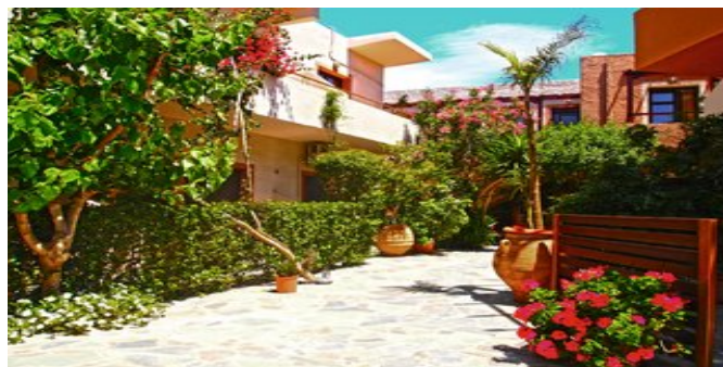
Die Appartements Lito

APPARTEMENT C (AB) Ca. 40 qm. Für 2-5 Personen. Lage im Erdgeschoss mit 2 separaten Eingängen. Grundausstattung wie die Studios. Wohn-/Schlafraum mit Doppelbett oder 2 Einzelbetten und gut eingerichteter Küche (Mikrowelle, Kaffeemaschine, Wasserkocher). 1 separater Schlafraum (mit 2 Einzelbetten oder 1 Doppelbett) und Schlafcouch sowie eigener Dusche/WC. Hauptbad mit Dusche/WC, Föhn. Terrasse oder Gemeinschaftsterrasse.