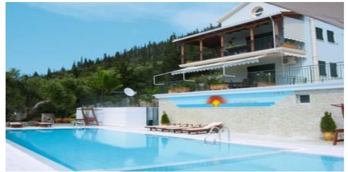
Die Anlage Liogerma