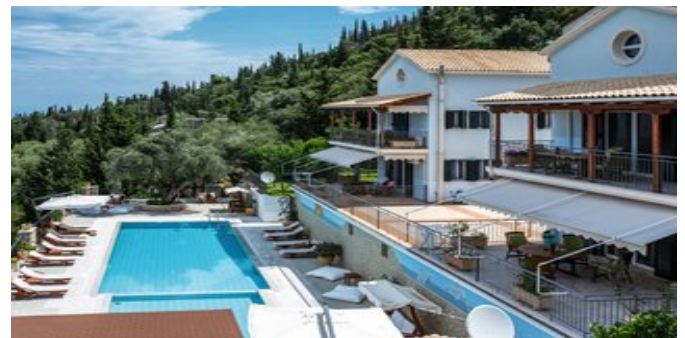
Die Appartements Liogerma