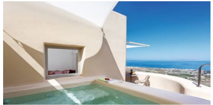
Auf der Veranda

WICHTIG Adults Only - das Hotel ist für Gäste ab