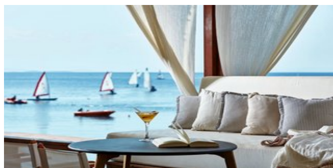
In der Strandbar