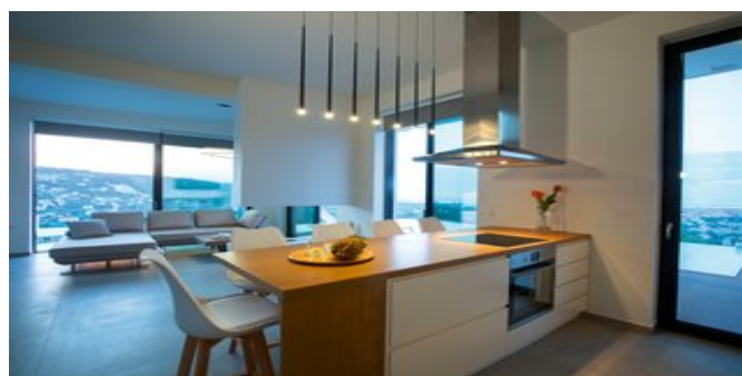
Küche Villa Citrine