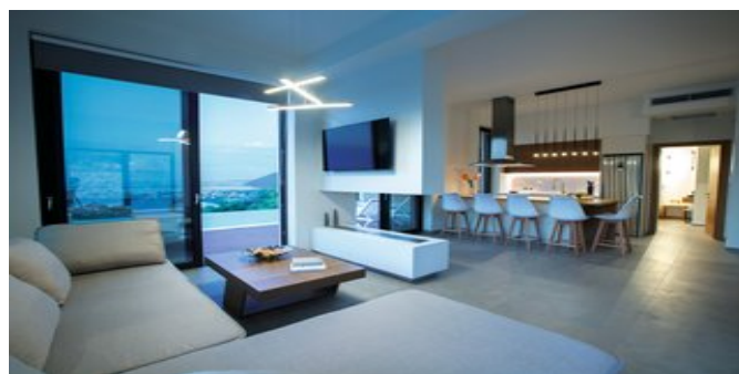
Wohnzimmer Villa Citrine