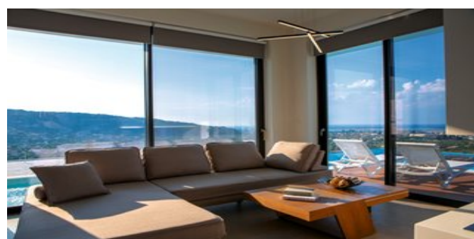
Wohnzimmer Villa Citrine