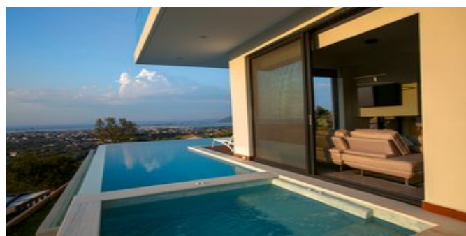
Blick auf den Pool