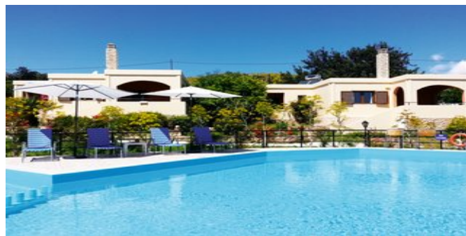
Die Marialena Villas mit Pool

POOLBEREICH 2 Süßwasserpools, einer davon mit Kinderbecken, einer nur für Erwachsene.