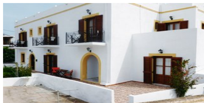
Blick auf die Pension