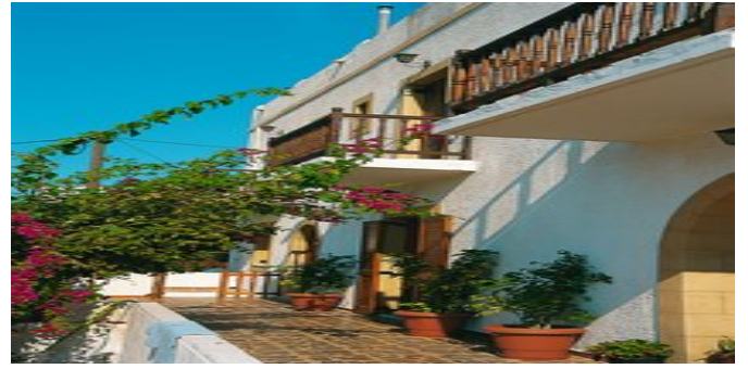
Die Pension Avgerinos