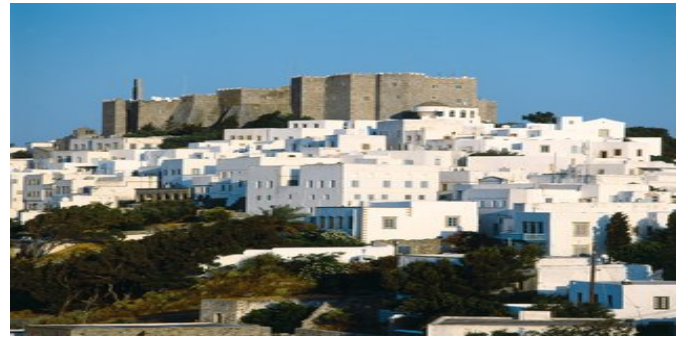
Skála mit dem Johannes-Kloster