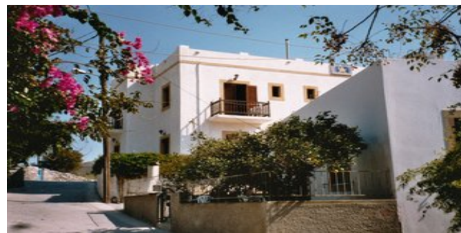
Die Pension Avgerinos

ATTIKA SERVICE Telefonische Betreuung durch deutschsprachige Reiseleitung. Fähr-/Landtransfer bei Pauschalreise inklusive.