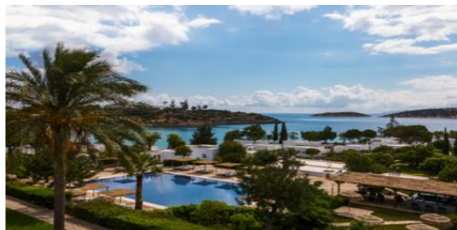
Blick auf die Anlage

HERITAGE BUNGALOW GARTENBLICK (BL) Ca. 40 qm. Für 2-3 Personen. Grundausrüstung wie die Bungalows Seafront, zusätzlich mit Kaffee-/Teekoher. Meerblick. Wohn-/Schlafraum mit Doppelbett und Schlafcouch für die 3. Person.