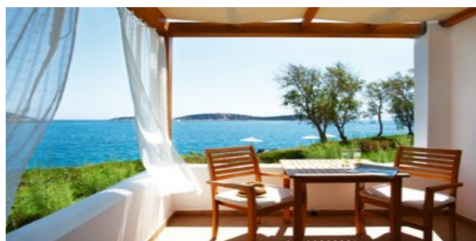
Wohnbeispiel Superior Bungalows Seafront