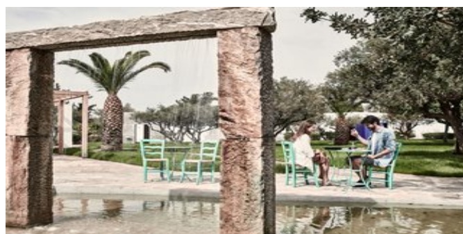
Im Kafaneion "Adeste"