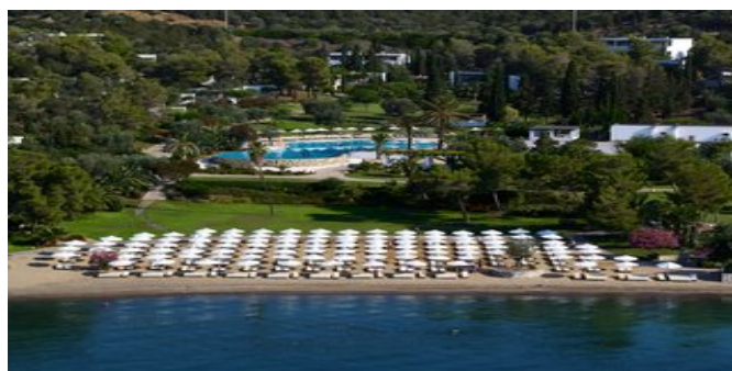
Blick auf den Strand