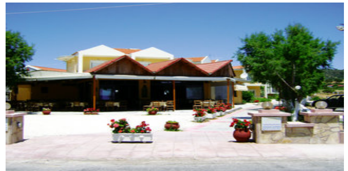
Blick auf die hoteleigene Taverne und das Hotel