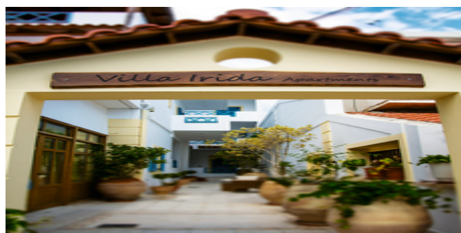
Die Villa Irida