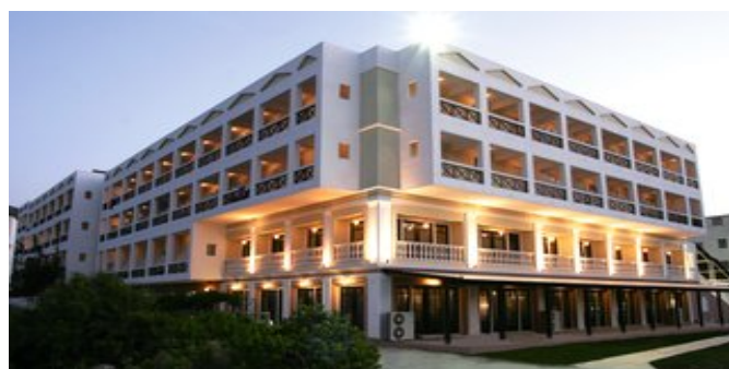
Das Hersonissos Palace Hotel