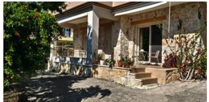
Iona Casa - Außenansicht