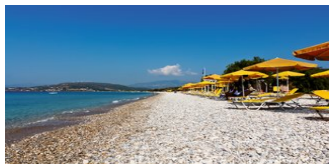
Der Strand bei der Anlage