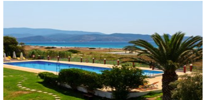
Blick auf den Pool und das Meer