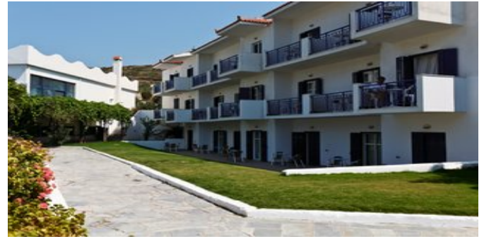
Das Saint Nicholas Hotel

HOTELCHARAKTER Ideal für Ruhesuchende und