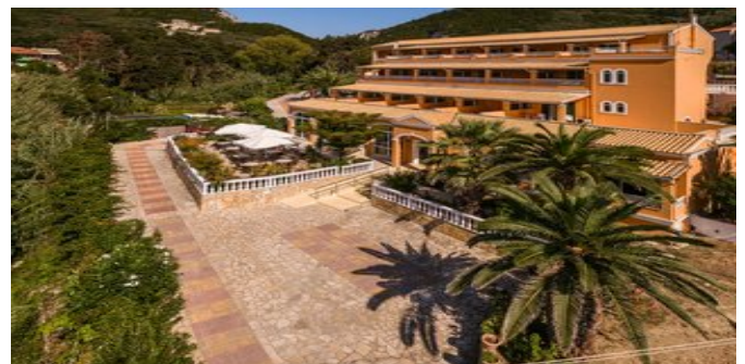
Das Paramonas Hotel