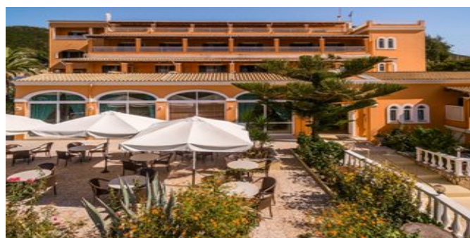
Das Paramonas Hotel